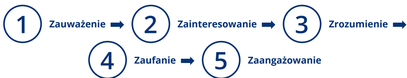
Rysunek 2. Etapy schematu komunikacji 5Z

Kluczowe w tym procesie jest rozumienie przekazu, czyli właściwa identyfikacja korzyści, które wynikają z Funduszy Europejskich.