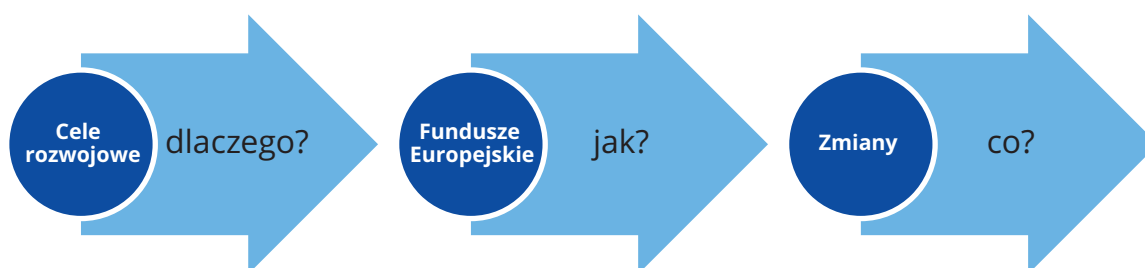
Rys. 1. Schemat: Jak formułować przekaz na temat Funduszy Europejskich?

Kiedy przystępujemy do tworzenia przekazu o Funduszach Europejskich, powinniśmy posługiwać się schematem (rys. 1). Nie ma znaczenia to, czy są to działania informacyjne czy promocyjne i do kogo je kierujemy. Schemat jest uniwersalny.